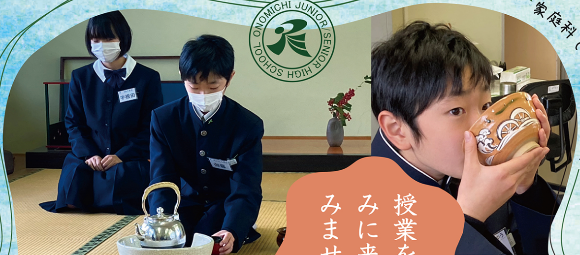
家庭科でのお茶会の様子